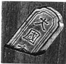
(図三)『小川破笠 江戸工芸の粹』より