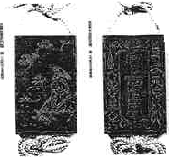
(図四)『小川破笠 江戸工芸の粹』より

続いて、「宝露臺」に材を採ったものを検討してみたい。これに関わる破笠の作品として、「宝露臺意匠印籠」(図四)および「宝露臺意匠聯」(図五)が知られている。ともに問題を孕む作品だと思われる。どこが問題なのかというと、『方氏墨譜』(図六)と『程氏墨苑』(図七)所収の「宝露臺」の記事を凝視してみると、もろもろの矛盾がみえてくるからである。破笠の「宝露臺意匠印籠」(図四)の場合、文字のデザイン化としては、『方氏墨譜』の方が合致する。ただし、そこに付されている絵柄は、「宝露臺」とは何の関係もない。あくまでも文字のデザインに興味を抱いただけであって、「宝露臺」そのものの概念が問題になっているわけではなさそうである。そこに仰々しくも『方氏墨譜』『程氏墨苑』の影響を観察する必要はない。