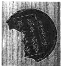
(図二)『小川破笠 江戸工芸の粹』より